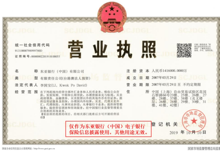
东亚银行（中国）有限公司营业执照、经营保险业务相关许可证